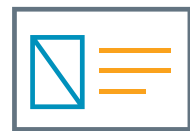
cartes en plastique

Téléchargez l'édition Free sur fr.SeagullScientific.com